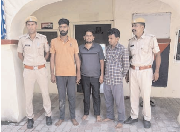
वाइस ऑफ प्रतिज्ञा अजमेर