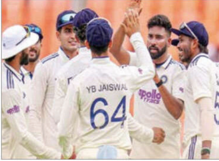
वहीं युवा जुरेल ने भी इस मैच में मिले अवसर का लाभ उठाते हुए शतकीय पारी खेली।

राहुल ने इस टेस्ट में अपना 11वां शतक जमाया ये उनका नौ साल के बाद धरतू धरती पर शतक है। इसके लिए राहुल ने गेदें खेलीं।