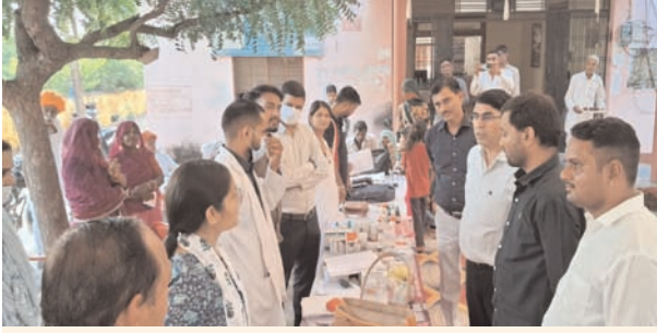
वाइस ऑफ प्रतिज्ञा अजमेर