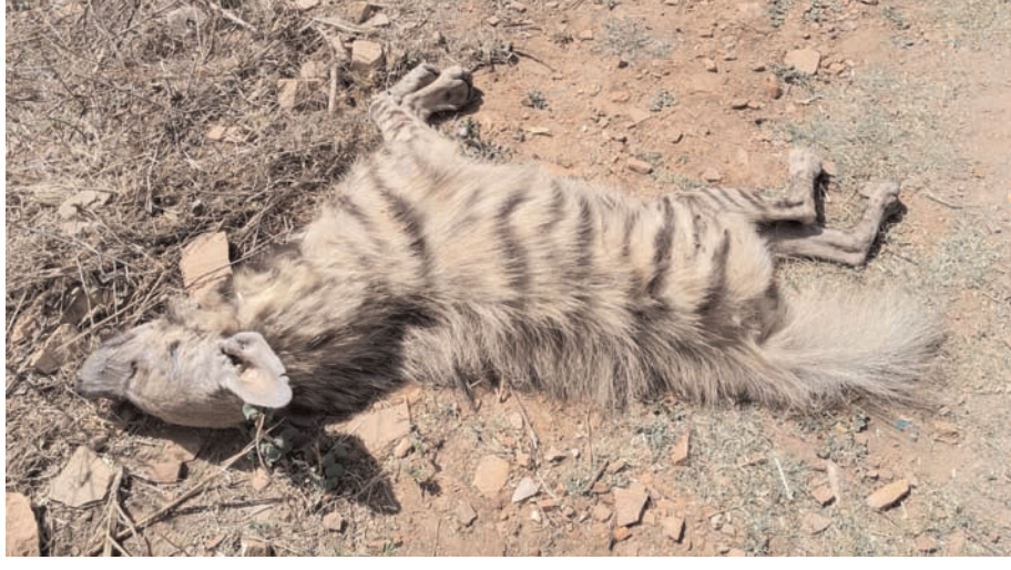
वाँडस ऑफ प्रतिज्ञा नारायणपुर