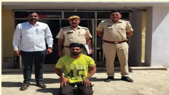
वाँडस ऑफ प्रतिज्ञा श्रीगंगानगर