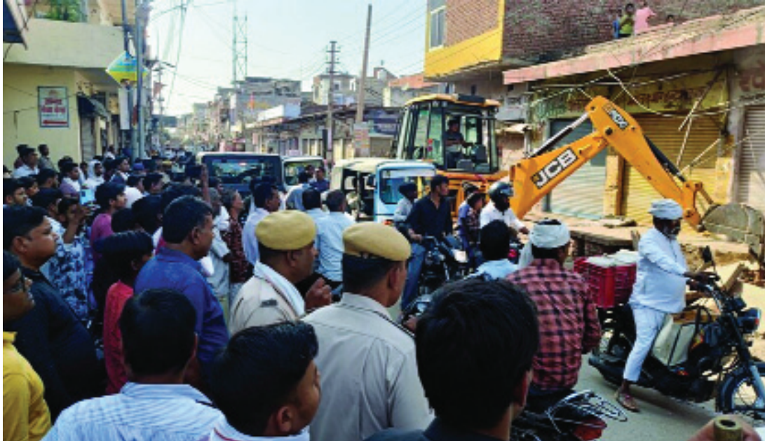
की ट्रैफिक व्यवस्था बिगड़ रही थी, वहीं आवागमन में लोगों को असुविधा हो रही थी, शहर के मुख्य बाजारों में दोनों तरफ दुकानों