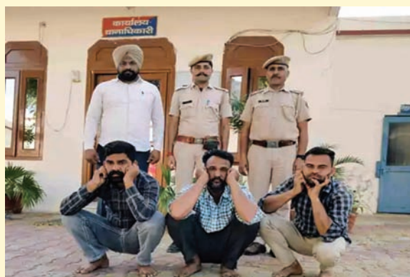
वाँडस ऑफ प्रतिज्ञा हनुमानगढ़