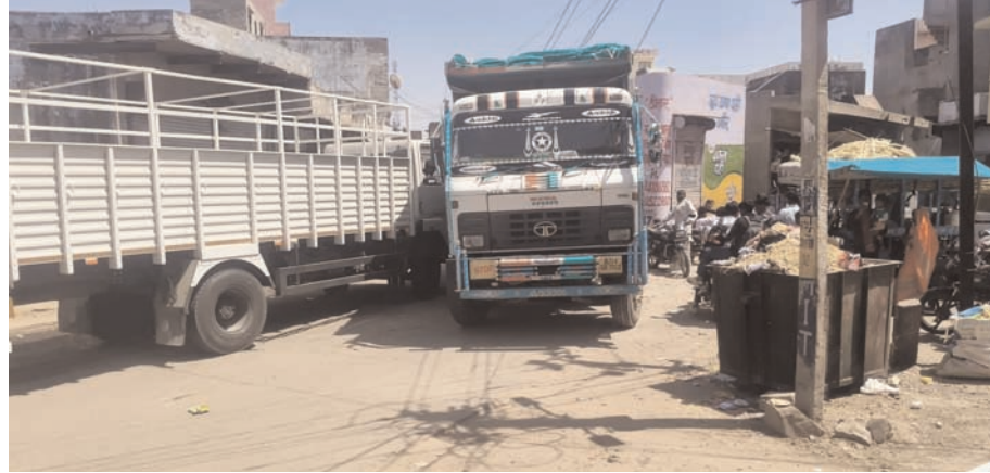
वाँडस ऑफ प्रतिज्ञा लक्ष्मणगढ़