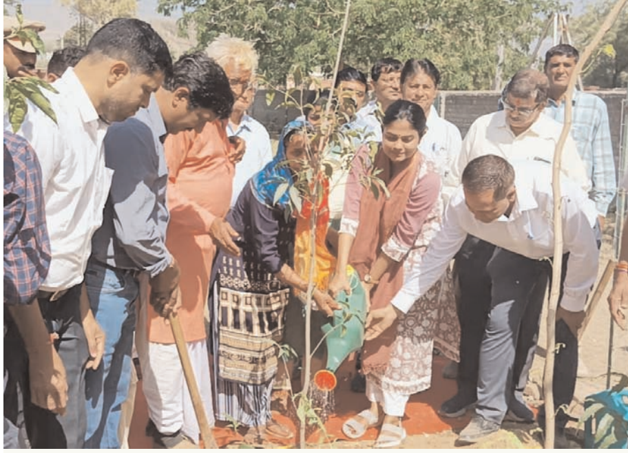
वाँडस ऑफ प्रतिज्ञा अलवर