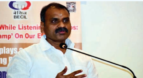
वाँइस ऑफ प्रतिज्ञा नई दिल्ली

सूचना और प्रसारण राज्य मंत्री एल मरुगन ने बुधवार को लोकसभा में प्रेस की स्वतंत्रता और रिक्रिंग में गिरावट के तर्क पर उठाए जा रहे सवालों का जवाब दिया। उन्होंने कहा कि भारत में मीडिया स्वतंत्र और सक्रिय रूप से विना किसी दबाव के काम कर रहे हैं, जिसे विदेशी संगठनों से मान्यता की जरूरत नहीं है। एल मरुगन ने कांग्रेस सांसद के सुधारकर्ता के एक लिखित प्रश्न के जवाब में यह बात कही, जिन्होंने 2024 में वैश्विक प्रेस स्वतंत्रता सूचकांक में भारत की रिक्रिंग में गिरावट के बारे में सवाल पूछा था। मंत्री ने कहा भारत में सक्रिय मीडिया प्रणाली है, जिसे विदेशी संगठनों से मान्यता की आवश्यकता नहीं है। बता दें कि मरुगन का यह बयान रिपोर्टर्स विदाउट बॉर्डर्स (आरएसएफ) द्वारा पिछले साल प्रकाशित रिपोर्ट के बाद आया है, जिसमें भारत को पत्रकारों की स्वतंत्रता के मामले में 180 देशों में से 159वां स्थान दिया गया था। केंद्र सरकार द्वारा प्रेस की स्वतंत्रता और पत्रकारों के अधिकारों की रक्षा के लिए उठाए गए कदमों के बारे में पूछे जाने पर, मंत्री ने बताया कि संविधान के अनुच्छेद 19 के तहत अभिव्यक्ति की स्वतंत्रता को सुरक्षित रखा गया है। इसके अलावा, उन्होंने कहा कि भारत में एक मजबूत न्यायिक प्रणाली है जो संविधानिक प्रावधानों को लागू करने में मदद करती है। इसके साथ ही मंत्री ने यह भी बताया कि प्रेस काउंसिल ऑफ इंडिया (पीसीआई) प्रेस की स्वतंत्रता की रक्षा के लिए काम करता है और शारीरिक हमलों तथा पत्रकारों पर हमलों से संबंधित शिकायतों का समाधान करता है। इसके अलावा इलेक्ट्रॉनिक मीडिया में प्रेस की स्वतंत्रता केवल टेलीविजन नेटवर्क (विनियमन) अधिनियम, 1995 के तहत एक स्व-नियामक तंत्र के द्वारा सुनिश्चित की जाती है।