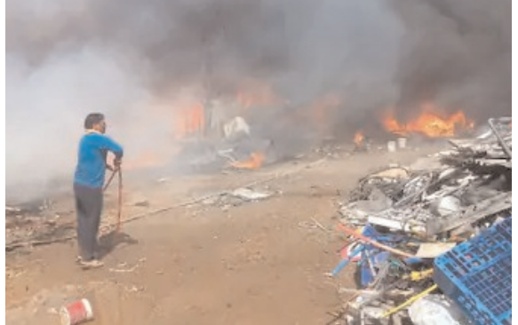
वाँइस ऑफ प्रतिज्ञा भिवाड़ी

भिवाड़ी औद्योगिक क्षेत्र के आकेड़ा गांव में बुधवार दोपहर करीब 2.30 बजे प्लास्टिक कबाड़ के एक गोदाम में भीषण आग लग गई। आग इतनी तेजी से फैली कि आसपास के इलाके में अफरा-तफरी मच गई। आग के साथ लगातार धमाकों की आवाजें गुंजन से दहशत का माहौल बन गया, जिससे लोग अपने घरों से बाहर निकलने पर मजबूर हो गए। ज्वलनशील पदार्थों की अधिकता के कारण आग तेजी से फैल गई और आसमान में काले धुएँ का गुबार छा गया। सूचना मिलते ही भिवाड़ी रोकें और हरियाणा के धारुड्डा से दमकल विभाग की टीम मौके पर पहुंची और आग बुझाने में जुट गई। लेकिन प्लास्टिक से निकलने वाले जहरीले धुएँ के कारण दमकलकर्मियों को मुश्किलों का सामना करना पड़ रहा है। स्थानीय लोग भी बाल्टियों से आग बुझाने में मदद कर रहे हैं। आग के गोदाम से सटे रियायशी इलाकों तक पहुंचने का खतरा बना हुआ है, जिससे लोग प्रशासन से त्वरित राहत और सुरक्षा की मांग कर रहे हैं। आग लगने का कारण अभी स्पष्ट नहीं हो सका है, लेकिन शॉर्ट सर्किट या चिंगारी से हादसे की आशंका जताई जा रही है। फिलहाल, दमकल कर्मी आग पर काबू पाने के प्रयास में जुटे हुए हैं, जबकि प्रशासन ने लोगों से सतर्क रहने और घटनास्थल से दूर रहने की अपील की है।