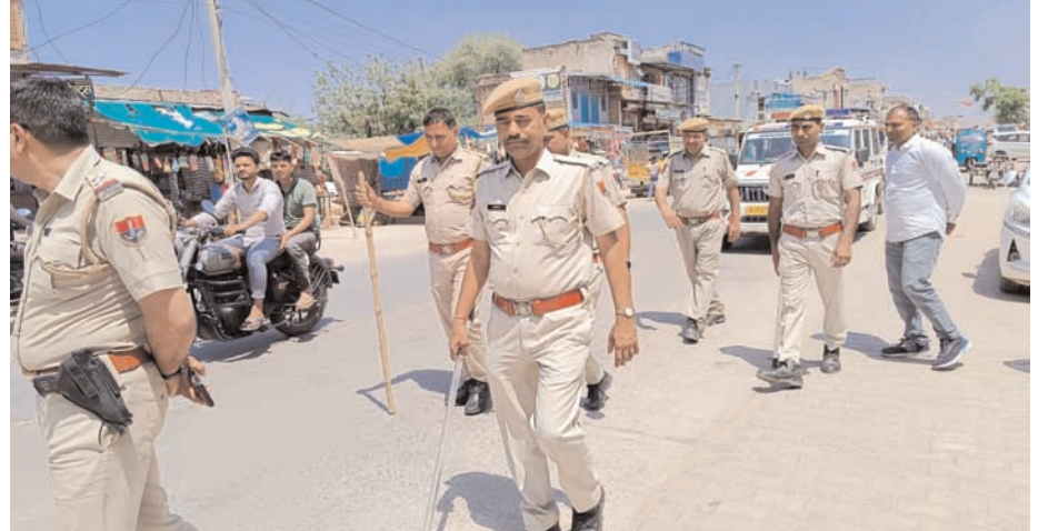
वाँडस ऑफ प्रतिज्ञा नारायणपुर