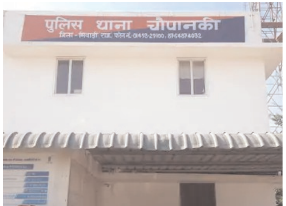
वाँइस ऑफ प्रतिज्ञा भिवाड़ी