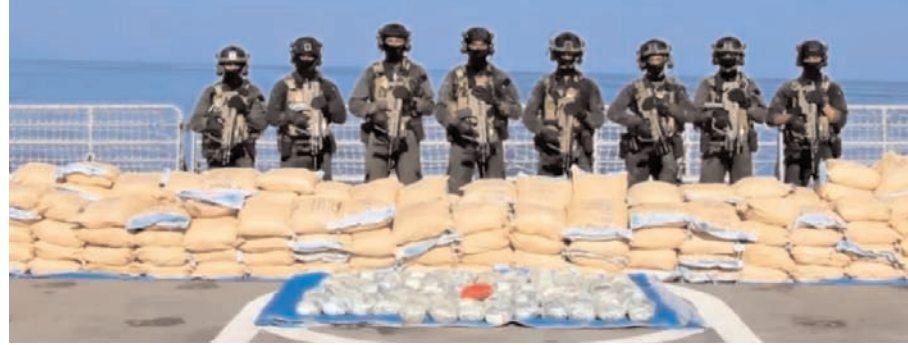
वाँइस ऑफ प्रतिज्ञा नई दिल्ली

भारतीय नौसेना के अग्रणी युद्धपोत आइएनएस तरकश ने पश्चिमी हिंद महासागर में 2,500 किलोग्राम से अधिक ड्रग्स जप्त की है। 31 मार्च को नौसेना को कुछ जहाजों की संदिग्ध गतिविधियों के बारे में सूचना मिली थी। इसके बाद अभियान चलाकर ये ड्रग्स जप्त किया गया। इस ड्रग्स में 2,386 किलोग्राम हशीश और 121 किलोग्राम हेरोइन शामिल है। यह सीलबंद पैकेटों में भरी हुई थी। नौसेना के प्रवक्ता ने बताया कि आपसपास के सभी संदिग्ध जहाजों से पूछताछ करने के बाद आइएनएस तरकश ने भारतीय नेवी की तीसरी आंख कहे जाने वाले पी8आइ समुद्री निगरानी विमान और मुंबई में समुद्री परिचालन केंद्र के साथ मिलकर एक संदिग्ध जहाज को रोका। इस दौरान संदिग्ध जहाज की गतिविधियों पर नजर रखने और क्षेत्र में