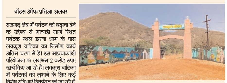
वाँडस ऑफ प्रतिज्ञा अलवर

राजगढ़ क्षेत्र में पर्यटन को बढ़ावा देने के उद्देश्य से माचाड़ी मार्ग स्थित पर्यटक स्थल झरना धाम के पास लवकुश वाटिका का निर्माण कार्य अंतिम चरण में है। इस महत्वाकांक्षी परियोजना पर लगभग 2 करोड़ रुपए खर्च किए जा रहे हैं। लवकुश वाटिका में पर्यटकों को लुभाने के लिए कई विशेष सुविधाएं विकसित की जा रही हैं, जिससे यह क्षेत्र का प्रमुख आकर्षण केंद्र बन सकता है। वन विभाग द्वारा इस परियोजना के तहत 18 फीट ऊंचे मुख्य गेट का निर्माण कार्य पूरा कर लिया गया है। पर्यटकों की सुविधा के लिए करीब ढाई किलोमीटर लंबा ईको ट्रैक तैयार किया गया है, जहां वे प्राकृतिक वातावरण में घूम सकते हैं। इस ट्रैक के साथ ही दो पक्के और दो पुलों के साथ हट्टों का निर्माण किया गया है, जिससे पर्यटकों को विश्राम स्थल भी उपलब्ध होगा।