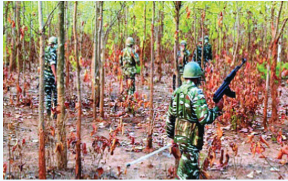
वाँइस ऑफ प्रतिज्ञा जगदलपुर