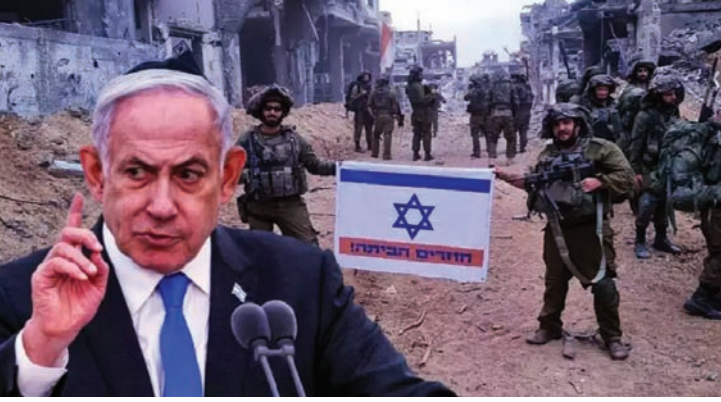
वाँइस ऑफ प्रतिज्ञा तेल अवीव

मंगलवार देर रात अरबी मीडिया के लिए इजरायली सेना के प्रवक्ता ने गाजा के दक्षिणी राफा क्षेत्र के निवासियों को अपने घर छोड़ने