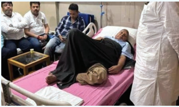
वाँइस ऑफ प्रतिज्ञा पटना

राष्ट्रीय जनता दल के सुप्रिमो लालू प्रसाद यादव की तबीयत बिगड़ गई है। डॉक्टरों ने उन्हें फौरन दिल्ली जाने की सलाह दी है। वह दो बजे एयर एंबुलेंस से दिल्ली रवाना हो सकते हैं। राजद सूत्रों की मानें तो लालू प्रसाद के ब्लड शुगर के स्तर में वृद्धि के कारण उनकी स्वास्थ्य स्थिति और गंभीर हो गई है। शुगर लेवल बढ़ने के कारण तकलीफ काफी बढ़ गई है। हालांकि, उनकी तबीयत पिछले दो दिन से खराब है। लेकिन, बुधवार सुबह से उनकी तबीयत में और भी गिरावट आई। पटना में चिकित्सकों ने उन्हें बेहतर इलाज के लिए दिल्ली जाने की सलाह दी है। राजद सूत्र बता रहे हैं कि राजद सुप्रिमो को दिल्ली के अखिल भारतीय आयुर्विज्ञान संस्थान में भर्ती कराया जाएगा, जहां विशेषज्ञ डॉक्टरों द्वारा उनका उपचार किया जाएगा। वहीं लालू प्रसाद जल्दी स्वस्थ हो जाएं, इसके लेकर उनके समर्थक लगातार दुआ मांग रहे। बता दें कि सात दिन पहले यानी 26 मार्च को राजद सुप्रिमो पटना के गर्दनीबाग में वक्फ संशोधन बिल के खिलाफ मुस्लिम संगठनों के धरना-प्रदर्शन में शामिल हुए थे। उनके साथ तेजस्वी यादव भी थे। उस वक्त लालू प्रसाद फिट नजर आ रहे थे। तब उन्होंने मोदी सरकार पर हमला बोलते हुए कहा कि हमलोग वक्फ बिल के विरोध में हैं। किसी के साथ अन्याय नहीं होगा। सरकार गलत कर रही है। नतीश कुमार उन लोगों के साथ हैं, जो इस बिल का समर्थन कर रहे हैं।